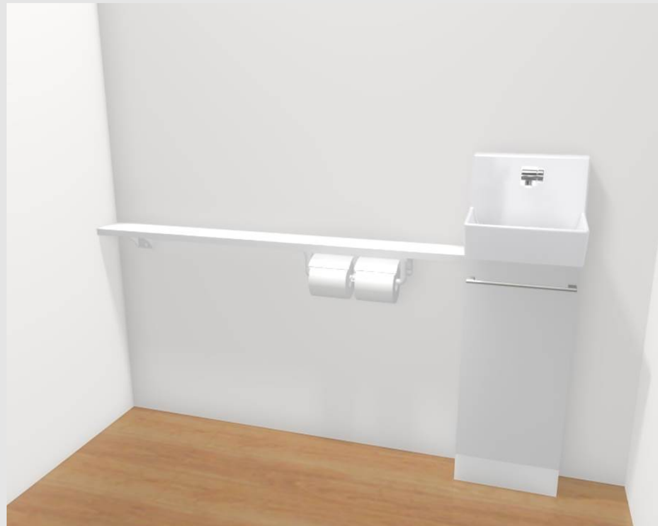
3DCGによるイメージ画像です。 反対壁に設置されている商品がある場合は表示されていません。